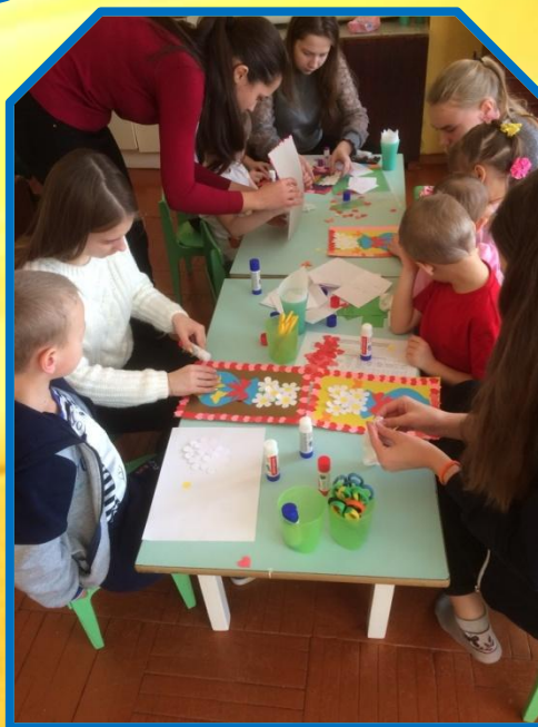
Волонтерская организация «Добротворцы»