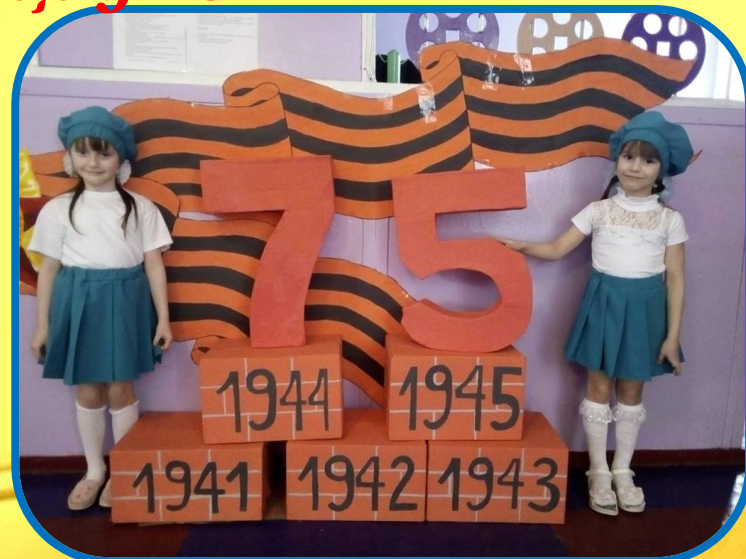
Музей МБОУ СОШ с Ульяновка